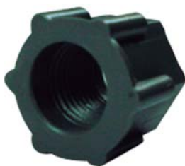
50301 Porca de 1/8".