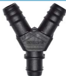
10171 Conector inicial tipo Y D.E 16mm. Usado com chula 16mm.