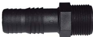
1083 Adaptador com rosca para tubo tradicional 1".