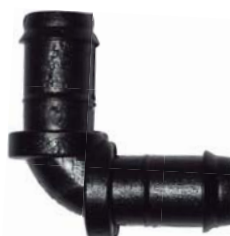
10182 Joelho D.E 17mm.