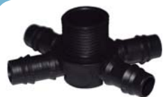
101842 Conector aranha com 4 saídas 3/4" x D.E 16mm rosca fêmea.