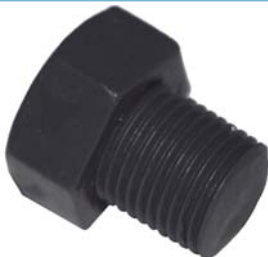
50361 Tampão de 8mm.