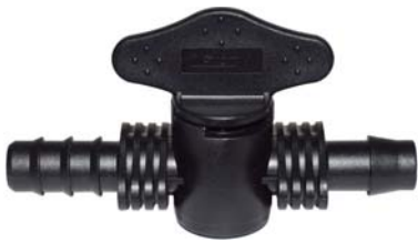
1064 Registro união Ranhurado D.I 13mm x conector. Usado com chula 16mm.