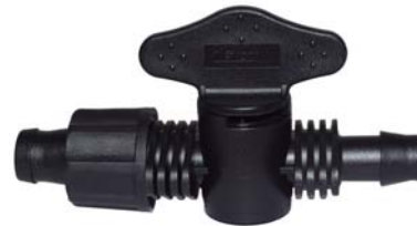
10642 Registro união fita x conector. Usado com chula 16mm.