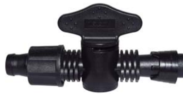
10645 Registro união fita x união com anel de 6 pontas D.I 16mm.