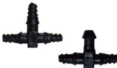
30303 Tee microtubo 5mm x 3mm (rosca x rosca x rosca).