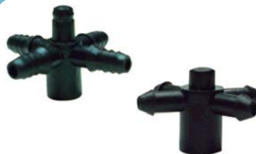
30351 Cruzeta Plastro 5mm x 3mm.