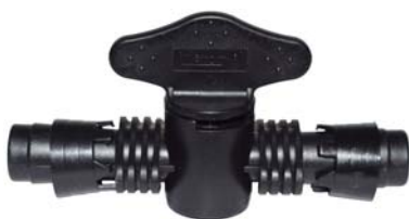
106421 Registro união D.I 16mm x D.I 16mm com anel 6 pontas.