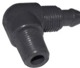
50201 Joelho com porca 8mm x 1/8".