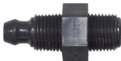
50101 Conector reto com porca 8mm x 1/8".