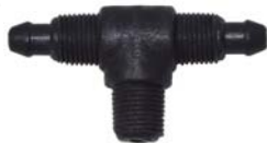
50423 Tee reto com porca 8mm x 1/8".