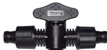
10689 Registro união fita x fita.