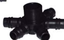
10183 Conector aranha com 6 saídas 3/4" x D.E 16mm rosca macho.