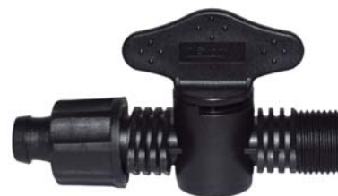
10644 Registro união fita x rosca 3/4\"/>