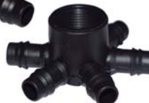
101843 Conector aranha com 4 saídas 3/4" x D.E 16mm rosca macho.