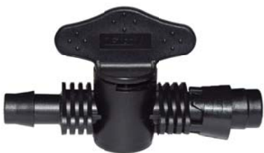
10643 Registro união conector x união com anel 6 pontas D.I 16mm. Usado com chula 16mm.