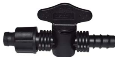
106407 Registro união fita x ranhurado D.I 13mm.