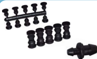
30201 Plug tampão fino 4mm x 7mm.