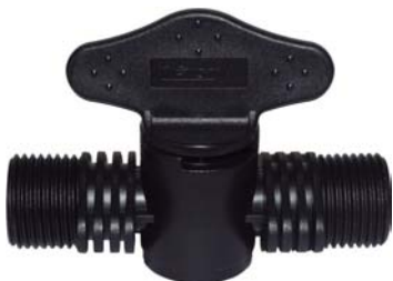
1069 Registro união rosca 3/4" x rosca 3/4\"/>