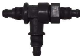
50412 Tee seletor com porca 8mm x 1/8".