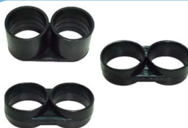
10201 Final de linha D.E 16mm.