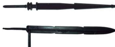
30101 Gotejador estabilizador para vaso sem tampão.