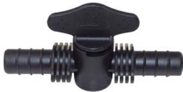
106422 Registro união ranhurado D.I 13mm x D.I 13mm.