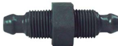
50501 União com porca 8mm x 1/8".