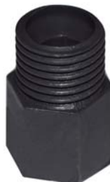
50351 Redução 1/4" x 1/8".