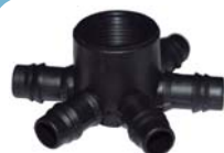
10181 Conector aranha com 6 saídas 3/4" x D.E 16mm rosca fêmea.