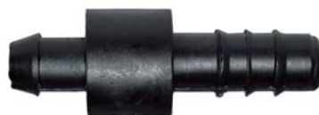
10121 Conector inicial D.E 12,5mm. Usado com chula 10mm.